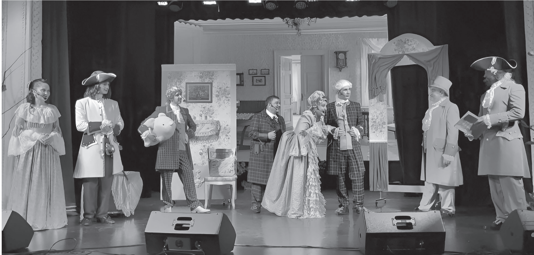
Сцена из спектакля «Недоросль» по произведению Дениса Фонвизина