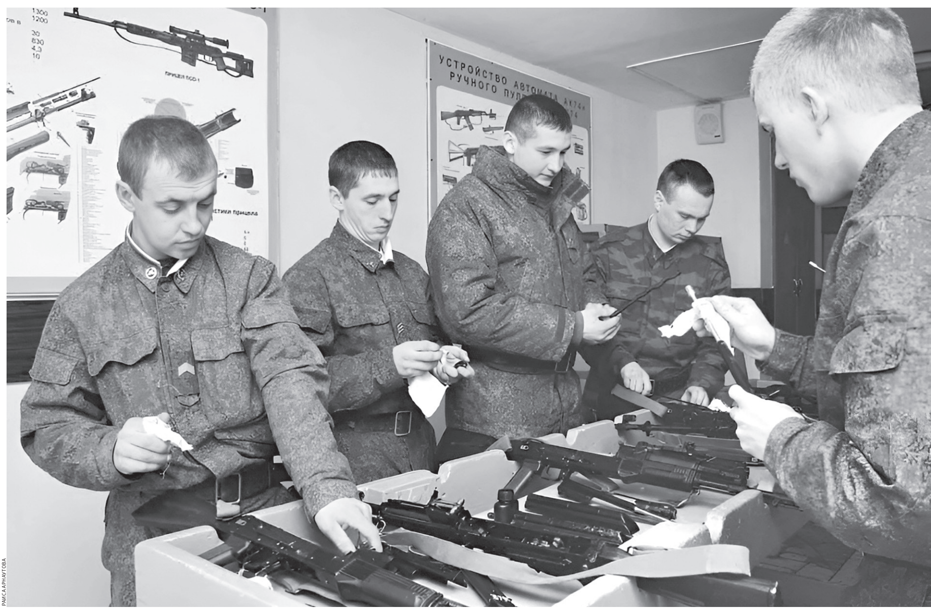
В армию ребята уходят подготовленными