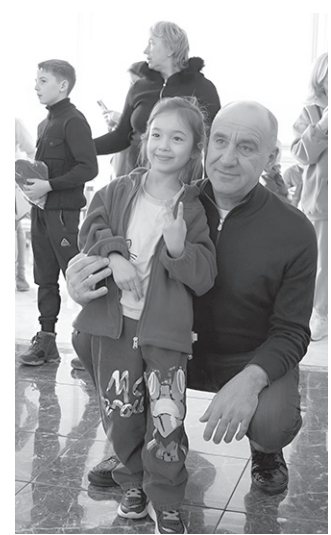
Фото на память с Рашидом Темрезовым

В республику прибыла группа жителей из Белгородской области, которые вынужденно оставили свои дома из-за обстрелов со стороны ВСУ. Их тепло поприветствовал Глава Карачаево-Черкесии Рашид Темрезов, который заверил гостей, что в республике будет сделано все возможное, чтобы они чувствовали себя комфортно, спокойно и безопасно. 238 жителей Белгородской области, среди которых более 100 детей, размещены в базах курортов Домбай и Теберда. Для прибывших созданы комфортные условия для проживания, дети школьного возраста продолжают учебу в школах Теберды и Домбая.