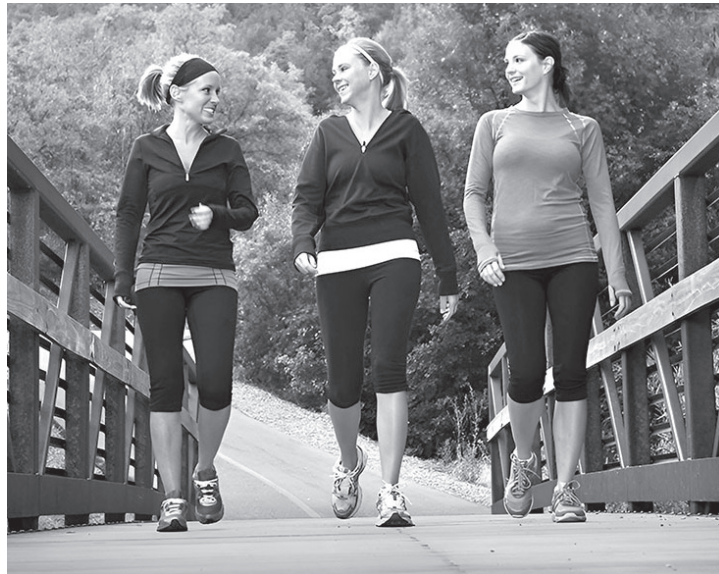
Прогулки на свежем воздухе повышают настроение

— Правильное дыхание — важный лечебный момент. Дышать лучше носом, дыхание должно быть полным или грудобрюшным, ритмичным — на 2–3 шага вдох, на 3–4 выдох. При появлении одышки следует остановиться или уменьшить темп